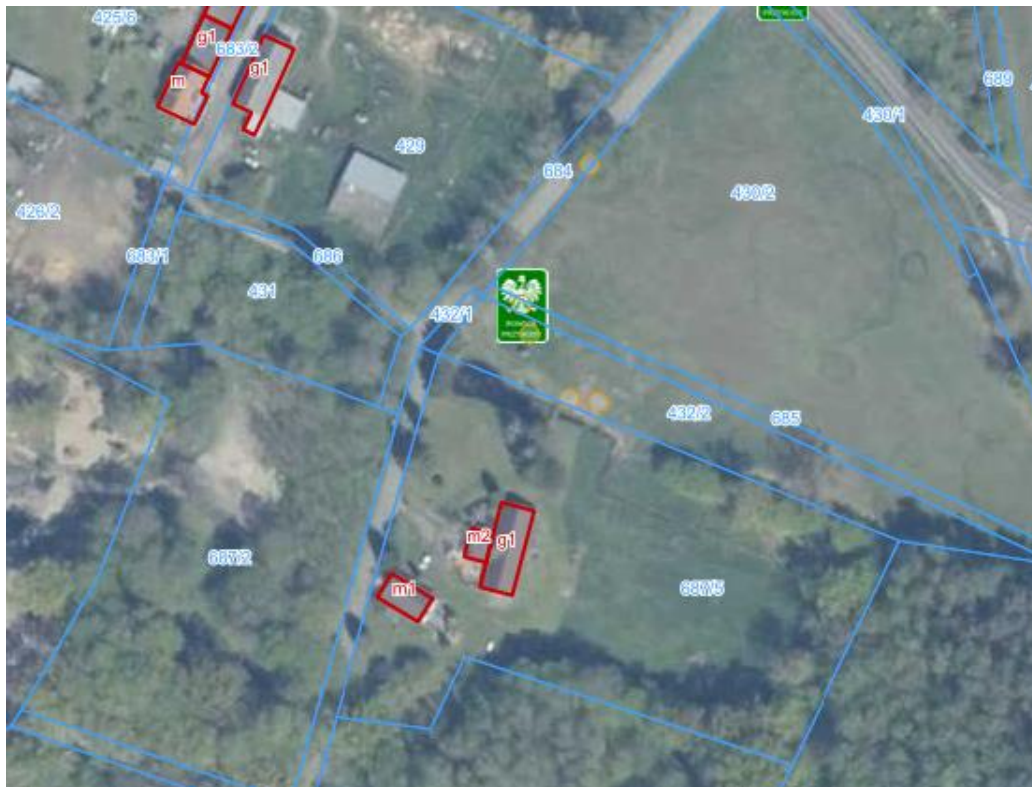
Drzewo Nr 1

Załącznik Nr 2 do Uchwały nr XIV/131/2026 Rady Miejskiej w Nowym Warpnie z dnia 18.03.2026 r.